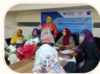
উইমেন এগেইন্সট ডায়ালগ এজরিথোর (ওয়েড)