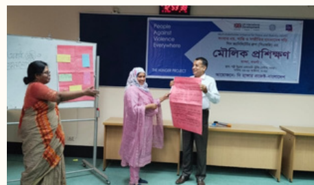
পিএফজি সদস্যদের মৌলিক প্রশিক্ষণ ও ওয়াইপিএজি সদস্যদের তরুণ নেতৃত্ব বিকাশ বিষয়ক প্রশিক্ষণের আয়োজন করে এমআইপিএস প্রকল্প।