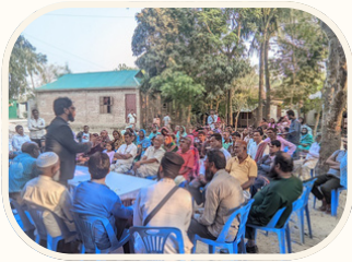
পিস ফরসিটিটিভ গ্রুপ (পিএফজি)

মাল্টি-স্টেকহোল্ডার ইনিশিয়েটিভ ফর পিস অ্যান্ড স্ট্যাবিলিটি (এমআইপিএস) প্রকল্প শান্তি, সম্প্রীতি ও স্থিতিশীল বাংলাদেশ গড়ার কাজে সহায়তার লক্ষ্যে কাজ করছে। এই প্রকল্পটি দি হাজার প্রজেক্ট বাংলাদেশ ও ইন্টারন্যাশনাল ফাউন্ডেশন ফর ইন্সটিটিউশনাল সিস্টেমস (আইএফইএস) এর যৌথ অংশীদারিত্বে যুক্তরাজ্য সরকারের ফরেইন কমন্ওয়েলথ এন্ড ডেভেলপমেন্ট অফিস (এফসিডিও) এর অর্থায়নে বাস্তবায়িত হচ্ছে। সম্মিলিত উদ্যোগে বাংলাদেশের রাজনৈতিক, ধর্মীয় ও জাতিগত সহিংসতার ঘটনা চিহ্নিত, প্রতিরোধ, প্রশমন ও নিষ্ক্রিয় করার মাধ্যমে সহনশীলতা বৃদ্ধি এবং সকলের মধ্যে শান্তি ও সম্প্রীতি জোরদার করাই এমআইপিএস প্রকল্পের লক্ষ্য ও উদ্দেশ্য।