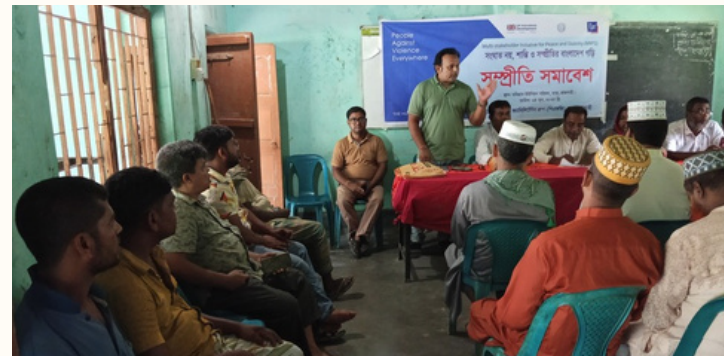
পৃথকভাবে আন্তঃধর্মীয় সংলাপ (বামে) ও সম্প্রীতি সমাবেশের আয়োজন করে চারঘাট ও বাঘা পিএফজি। এতে স্থানীয় প্রশাসন, নাগরিক সমাজ, ধর্মীয় নেতা ও স্থানীয়রা অংশগ্রহণ করেন।