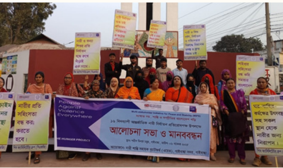
নারী নির্যাতন প্রতিরোধ পক্ষ ২০২৫ উপলক্ষে গাইবান্ধা সদর (বামে) ও নওগাঁ রাণীনগর ওয়েভ'র আয়োজনে অনুষ্ঠিত পৃথক মানববন্ধনে সহিংসতাকারীদের দ্রুত বিচার, আইন শক্তিশালীকরণ ও তরুণসহ সবাইকে সচেতন করার আহ্বান জানানো হয়।