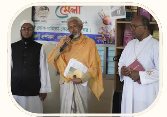
ইন্টারফেইথ পিস প্ল্যাটফর্ম (আইএফপিডি)