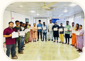
ইয়ুথ পিস অ্যান্ডসেডের গ্রুপ (ওয়াইপিএজি)