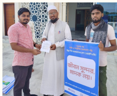
তরুণদের সামাজিক উদ্যোগ প্রকল্পের অংশ হিসেবে মাদক সম্পর্কে সচেতনতা গড়ে তুলতে সচেতনতামূলক প্রচারণা চালিয়েছে দুপচাঁচিয়া ওয়াইপিএজি।