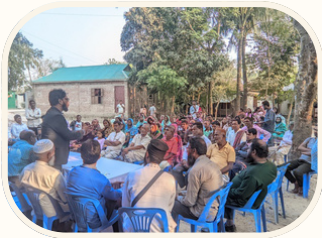
পিস ফরসিনিটের গ্রুপ-পিএফজি

মাল্টি-স্টেকহোল্ডার ইনিশিয়েটিভ ফর পিস অ্যান্ড স্ট্যাবিলিটি (এমআইপিএস) প্রকল্প শান্তি, সম্প্রীতি ও স্থিতিশীল বাংলাদেশ গড়ার কাজে সহায়তার লক্ষ্যে কাজ করছে। এই প্রকল্পটি দি হাজার প্রজেক্ট বাংলাদেশ ও ইন্টারন্যাশনাল ফাউন্ডেশন ফর ইন্সটিটিউশনাল সিস্টেমস (আইএফইএস) এর যৌথ অংশীদারিত্বে যুক্তরাজ্য সরকারের ফরেইন কমন্ওয়েলথ এন্ড ডেভেলপমেন্ট অফিস (এফসিডিও) এর অর্থায়নে বাস্তবায়িত হচ্ছে। সম্মিলিত উদ্যোগে বাংলাদেশের রাজনৈতিক, ধর্মীয় ও জাতিগত সহিংসতার ঘটনা চিহ্নিত, প্রতিরোধ, প্রশমন ও নিষ্ক্রিয় করার মাধ্যমে সহনশীলতা বৃদ্ধি এবং সকলের মধ্যে শান্তি ও সম্প্রীতি জোরদার করাই এমআইপিএস প্রকল্পের লক্ষ্য ও উদ্দেশ্য।