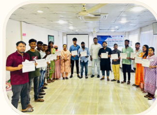
ইয়ুথ পিস অ্যান্সাসেডের গ্রুপ-ওয়াইপিএজি