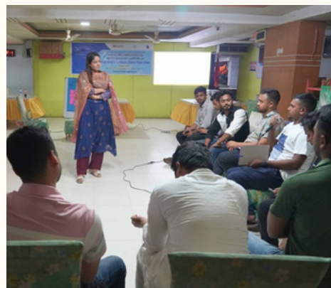
কুমিল্লার লাকসাম (বামে), কক্সবাজারের রামু (মাঝে) ও ফেনীর দাগনভূঞা উপজেলা (ডানে) ওয়াইপিএজি সদস্যদের জন্য জেভার সহিংসতা বিষয়ক প্রশিক্ষণ অনুষ্ঠিত হয়।