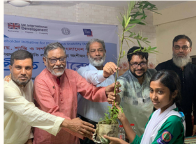
মুন্সীগঞ্জের সিরাজদিখান পিএফজির উদ্যোগে সম্প্রীতি সমাবেশ ও ওয়াইপিএজি এর উদ্যোগে সম্প্রীতির বৃক্ষরোপণ অনুষ্ঠিত হয়।