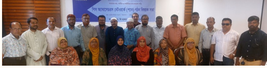
ঢাকা (বামে) ও কক্সবাজারে (ডানে) এমআইপিএস কর্মএলাকার পিস অ্যাম্বাসেডর ও কোঅর্ডিনেটরদের নিয়ে পিস অ্যাম্বাসেডরস নেটওয়ার্ক-প্যান গঠন করা হয়েছে।