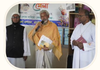
ইন্টারফেইথ পিস ডািফর্ম-আইএফপিডি