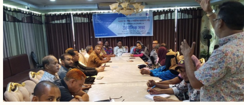
ফেনী সদর উপজেলা (বামে) ও কুমিল্লার লাকসাম (ডানে) উপজেলা পিএফজি সদস্যদের ত্রৈমাসিক সভা অনুষ্ঠিত হয়।